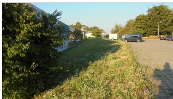
Grünfläche trockener bis feuchter Standorte sowie gepflasterte Parkplatzfläche.