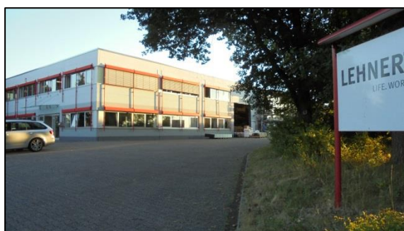
Gewerbliche Nutzung (Halle/Gebäude).

Zur Erfassung der Biotop- und Nutzungstypen des Plangebiets wurde im Juli 2018 eine Geländebegehung durchgeführt. Das Plangebiet ist vorwiegend durch eine gewerbliche Nutzung (Halle, Gebäude, Silo) sowie den dazugehörigen gepflasterten Parkplatzflächen und asphaltierten Zufahrten geprägt. Innerhalb des Plangebietes befinden sich mehrere Grünflächen trockener bis feuchter Standorte, Zierpflanzenbeete, ein dichter Gehölzbestand im südlichen Plangebiet sowie eine Gehölzhecke im Norden.