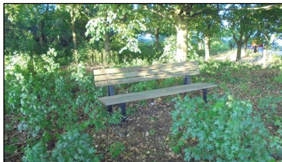
Sitzbank innerhalb des dichten Baumbestandes.

Im Bereich des Grünlandes trockener bis frischer Standorte wurden die folgenden Pflanzenarten erhoben: