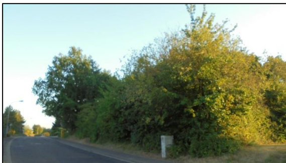
Dichter Baumbestand im Süden des Plangebietes.