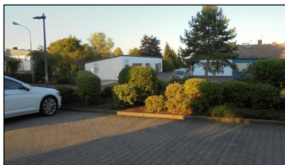
Zierpflanzenbeet mit Gehölzen.